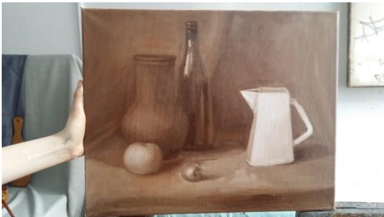
Учебная работа. Завершение подмалёвка. СХУ им.К.С. Петрова-Водкина. 2018