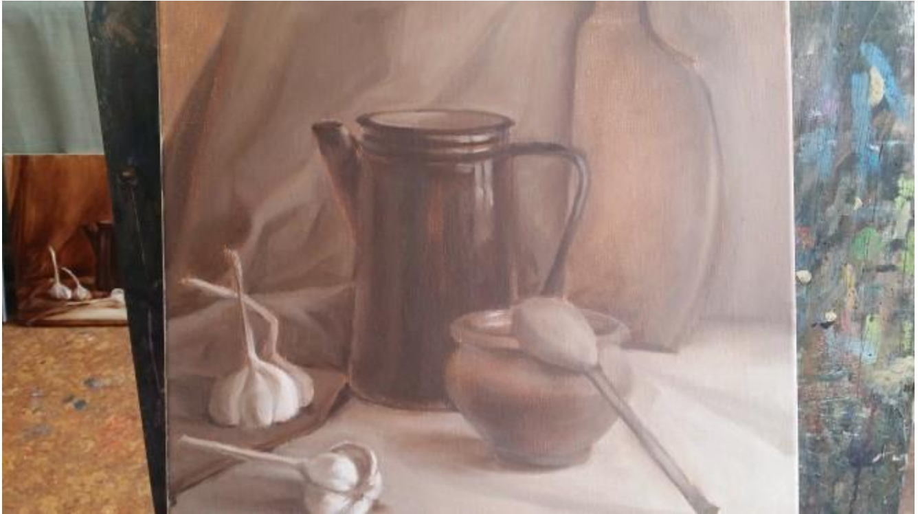
Учебная работа. Завершение подмалёвка. СХУ им.К.С. Петрова-Водкина. 2018

Эти варианты работы необходимо использовать для того, чтобы не перетемнить самые темные предметы и не высветлить самые светлые, уберечься от тональной и композиционной раздробленности. Таким образом, внимание должно быть обращено на то, чтобы выявить разницу в тоне с учетом плановости натюрморта и композиционными акцентами: чем предметы ближе к нам – тем они контрастнее по тону, чем дальше, тем больше смягчается их тон и форма, теряется насыщенность и тональная контрастность. Более значимые композиционные акценты в касаниях выполняются более контрастно и звучно.